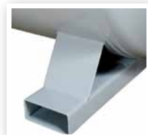
Løftelomme for truck